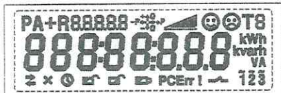
Тестовый режим. Активны все сегменты дисплея